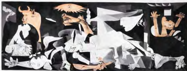
Guernica, 1937 245 cm x 216 cm

La obra es la reacción del pintor sobre el bombardeo de la ciudad de Guernica, durante la guerra de España que simboliza la anti guerra. Este obra es azul, negra y blanca. Esto en el museo nacional de Madrid. Picasso dice que la pintura representa la crueldad y la sacralidad de la guerra.