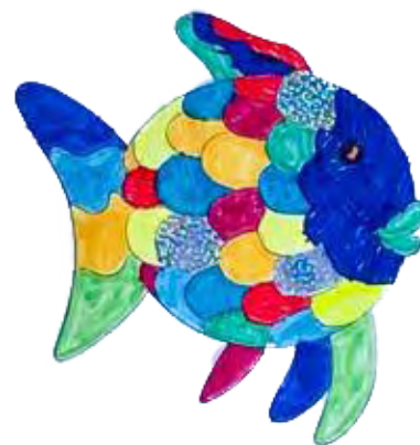
Le poisson Arc-en-ciel - Livre de Marcus Pfister