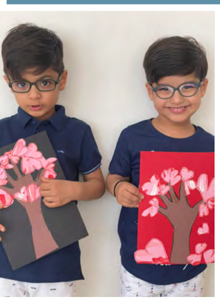
Les photographies sans masque ont été prises à la maison.